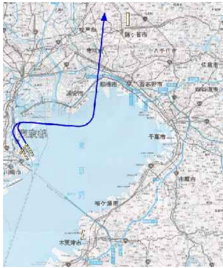
図-3-1 飛行経路概略図：34離陸