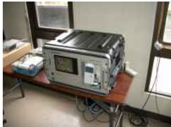
航空機騒音自動測定装置本体