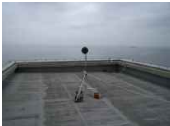
マイクロホン及び全天候防風スクリーン