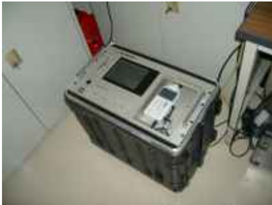
航空機騒音自動測定装置本体