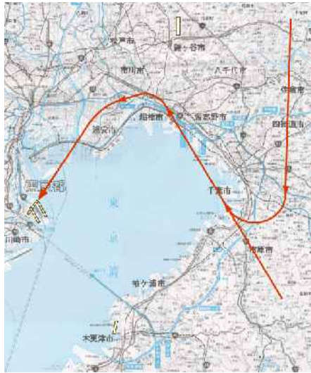
図-3-3 飛行経路概略図：22ILS着陸