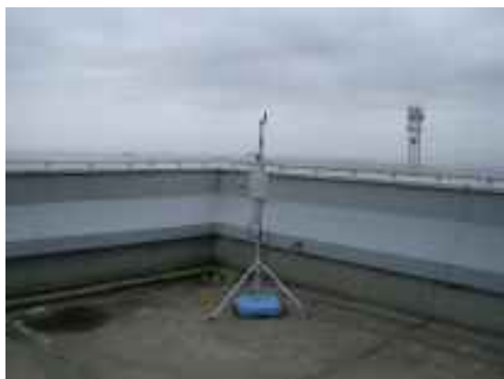
航空機接近検知識別センサー