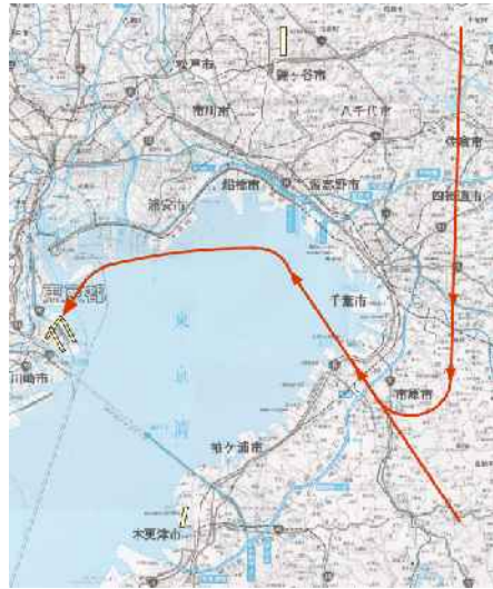
図-3-4 飛行経路概略図：22VOR/DME着陸