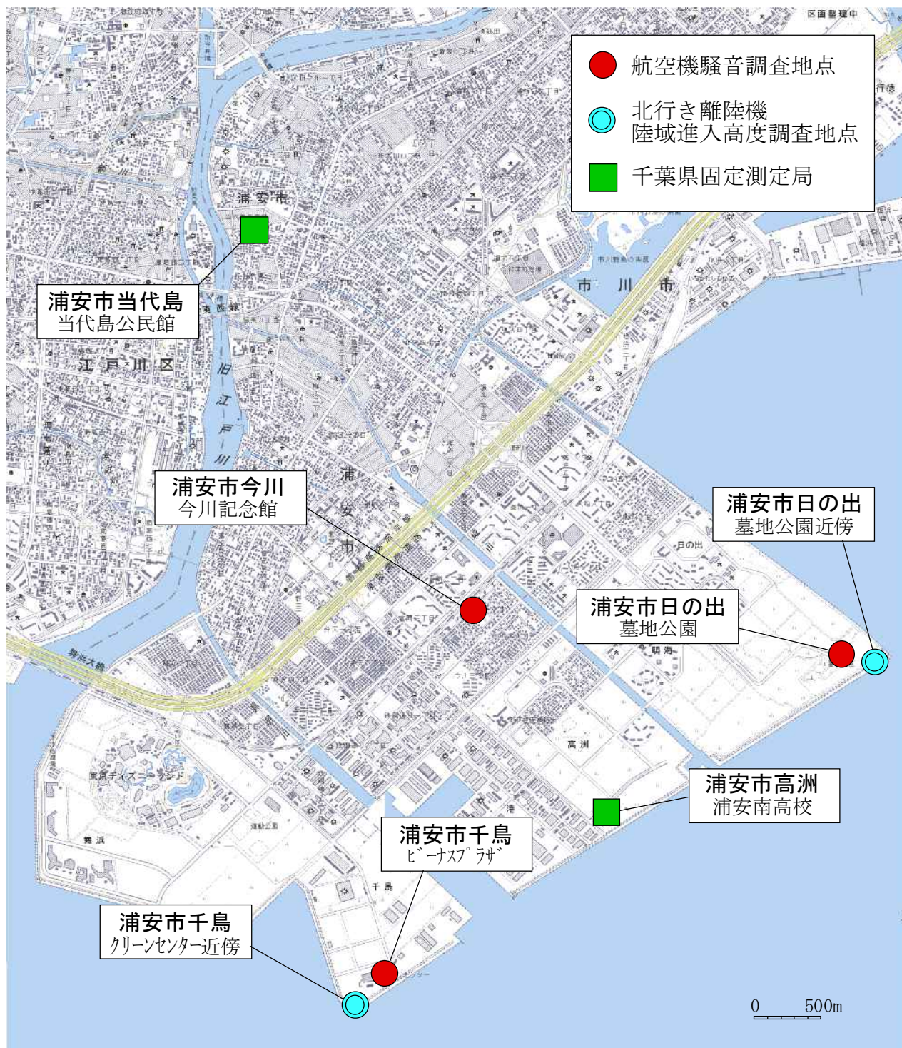
図-1 調査地点位置図