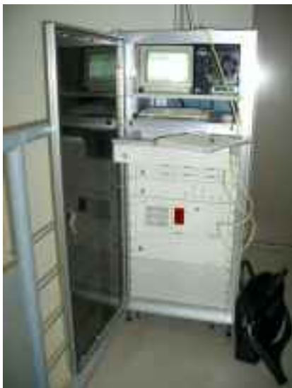
航空機騒音自動測定装置本体