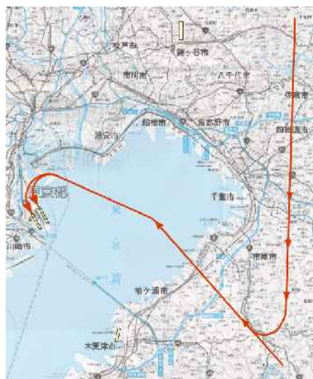
図-3-5 飛行経路概略図：16着陸