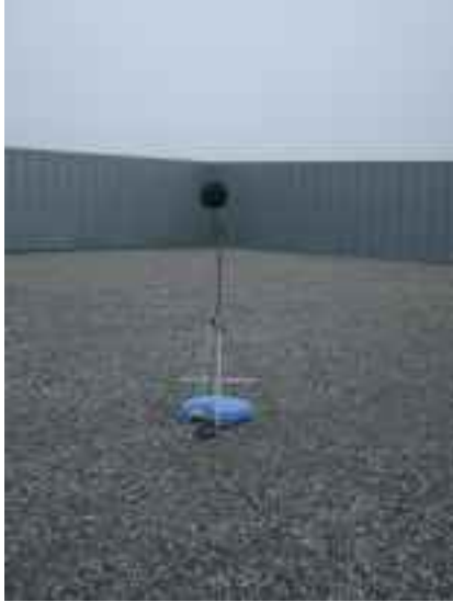
マイクロホン及び全天候防風スクリーン