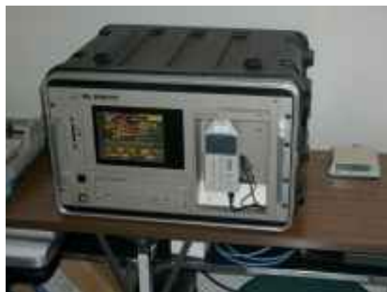
航空機騒音自動測定装置本体