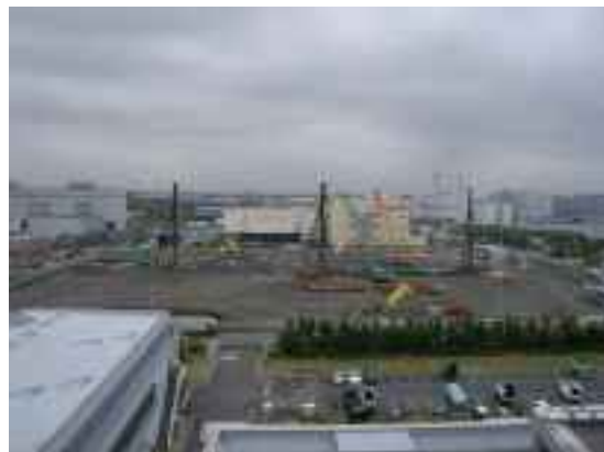
ビーナスプラザ北側での建設工事