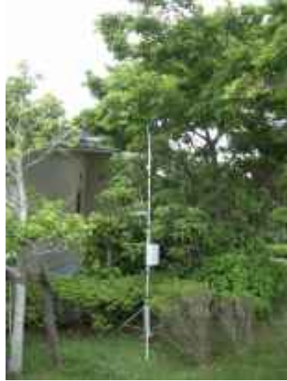
航空機接近検知識別センサー