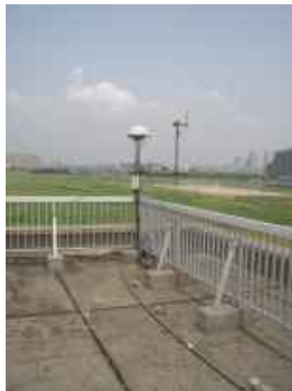
マイクロホン及び全天候防風スクリーン