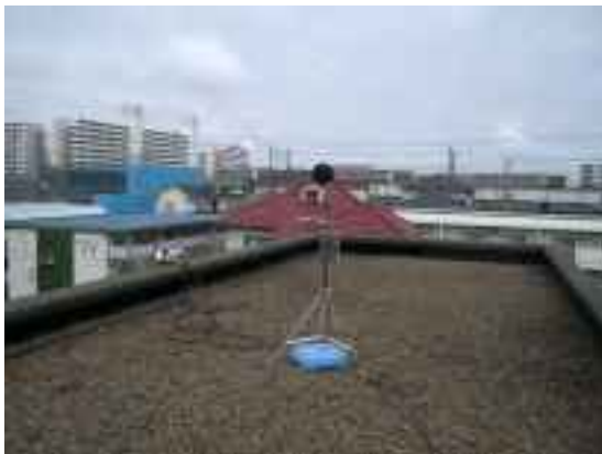
マイクロホン及び全天候防風スクリーン 航空機接近検知識別センサー