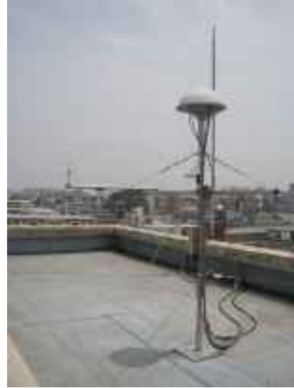
左：航空機接近検知識別センサー