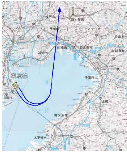
図-3-2 飛行経路概略図：16離陸