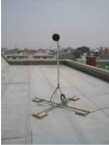
マイクロホン及び全天候防風スクリーン