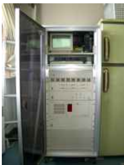
航空機騒音自動測定装置本体