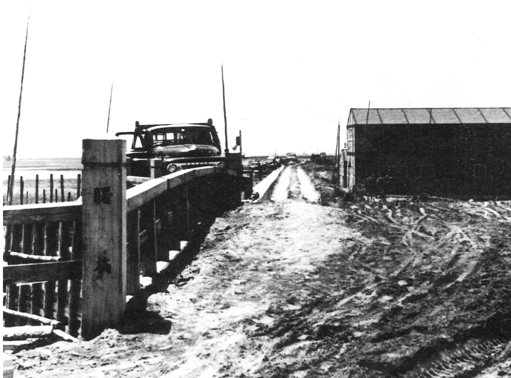
あけぼの橋(昭和30年代初め)