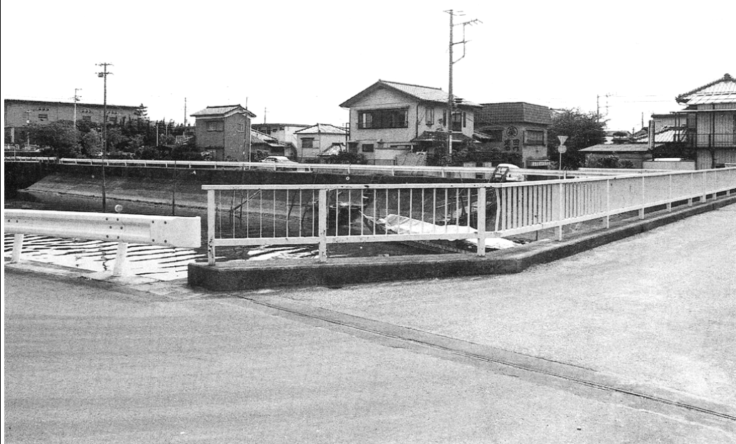
あけぼの橋(1990年)