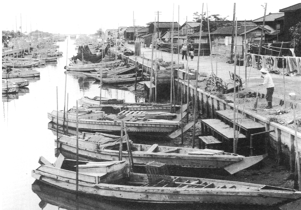
江川橋から東水門を臨む(昭和30年頃)