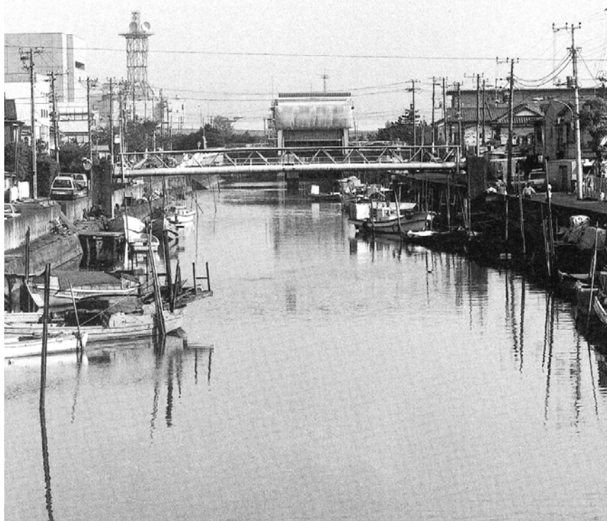
江川橋から東水門を臨む(1990年)