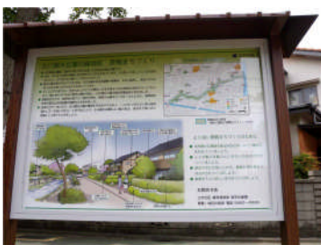
古川親水公園 ：沿線の景観まちづくりの目標やイメージがイラスト入で掲示されている。