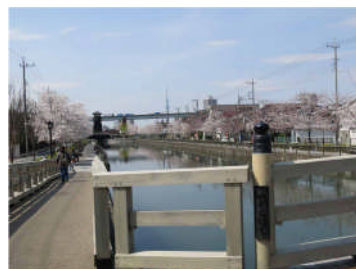
新川親水河川 ：行徳の塩を江戸へと運ぶ水路であった新川を「千本桜計画」の名のもとに江戸のイメージで再整備している。川底には何と公共駐車場が作られている。(注：本写真は視察日とは別に再撮影したもの)