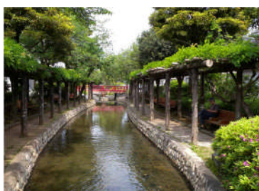
古川親水公園 ：下水道の整備とともに埋め立てられる予定だったが、川を残して欲しいという地域の声により、水の流れる公園として再生された。