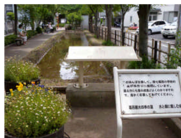
葛西親水四季の道 ：長島川が水と緑と彫刻のある四季の道に生まれ変わった。子ども達が水田耕作を体験出来る場所もある。