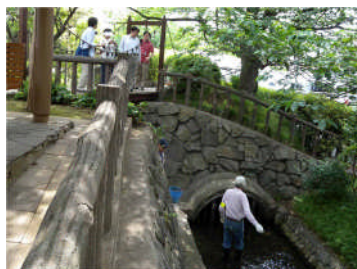
古川親水公園 ：えどがわ環境財団による定期的の清掃作業(古川を愛する会の人達による日常的清掃も行われている)