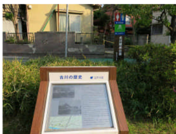
古川親水公園 ：沿線の看板には従前の写真とともに親水公園に生まれ変わった経緯などが記されている。