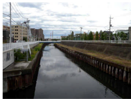
猫実川の現状: 親水化することで元町地域の貴重な景観軸となる可能性を秘めている