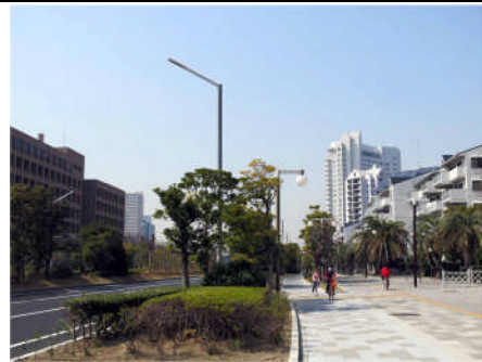
シンボルロード: 中町・新町の最重要景観軸となっている