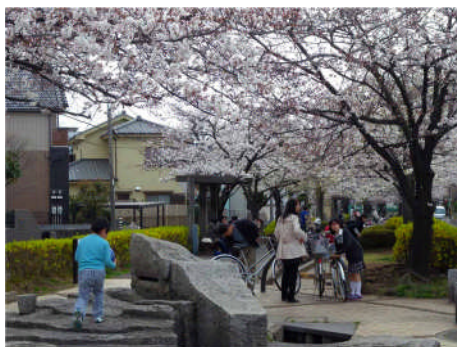
しおかぜ緑道: どぶ川と化したかつての用水路が今は老若男女の憩いの場となっている