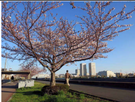
境川(新町の親水護岸): 周辺の新しい建物とともに浦安らしい水辺の景観を形成している