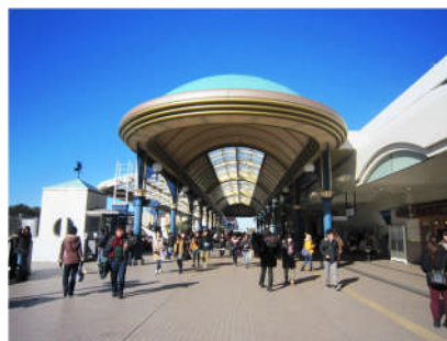
2、浦安の転換点となった、京葉線開通（1988 年）舞浜駅