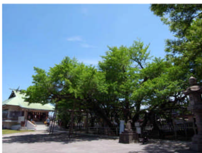
1、大銀杏で有名な市内最古の豊受神社（1157 年創建）