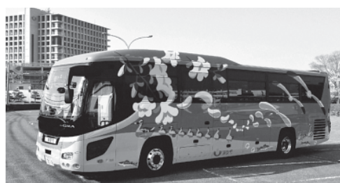
リフト付き大型バス「スマイル号」