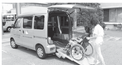
福祉車両「ハートフル号」