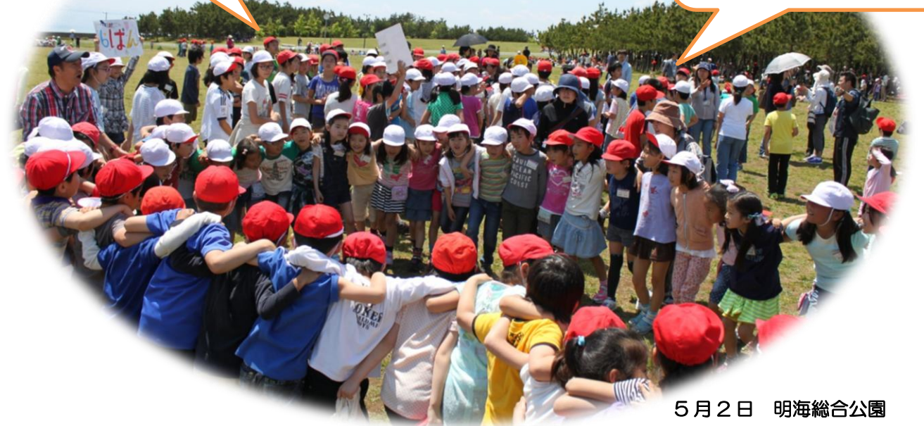
5月2日 明海総合公園

みんなと、「はんかちおとし」ができて、よかったです。ようちえんでいっしょだった友だちともあえてよかったです。