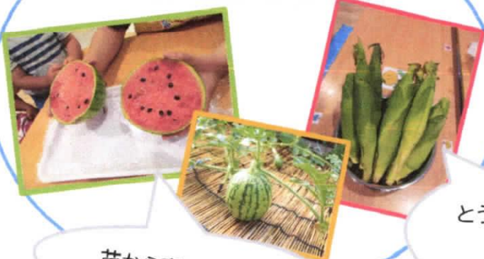
苗から育てたスイカ