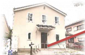
ことのは保育園外観