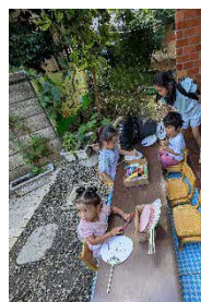
夏祭り、 みんなで 遊んだ よ！