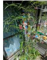
さやえんどう ができました