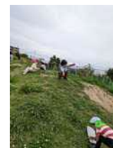
遠足 行ったよ！みんなで遊 んだよ！