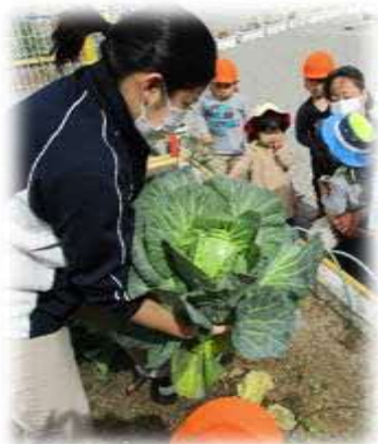
園庭の田んぼと畑で収穫