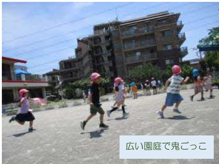
広い園庭で鬼ごっこ