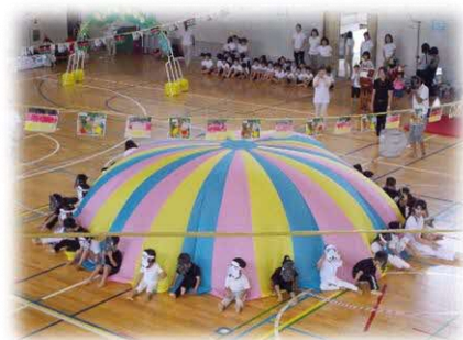
スポーツフェスティバル