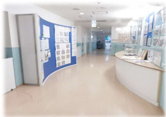
5階 保育園エントランス