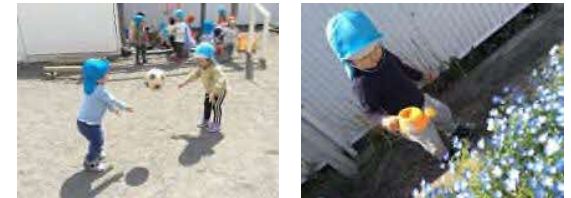
【5 歳児保育室】毎日見つかる新しい発見