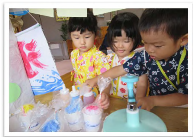
《夏まつり》《節分》など 季節の行事を大切にしています。