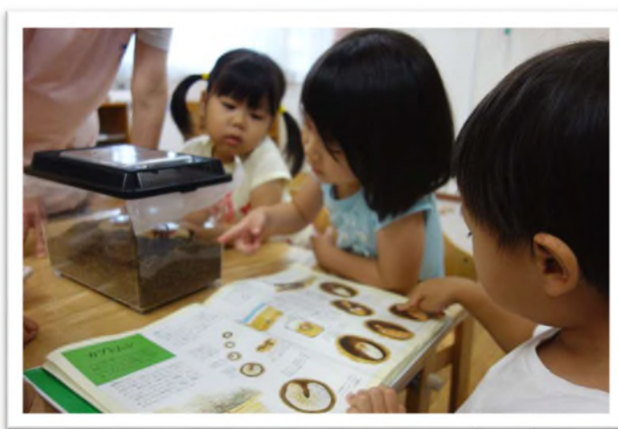
生き物との触れ合いを通し、 好奇心や豊かな愛情が育まれます。