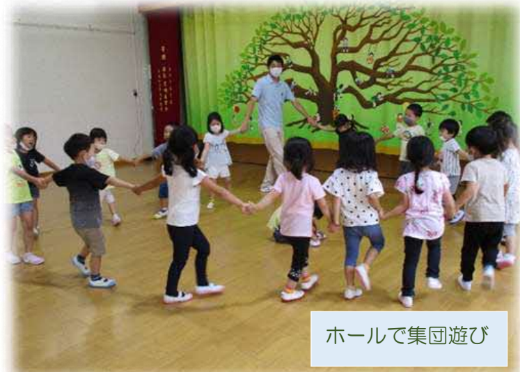
ホールで集団遊び