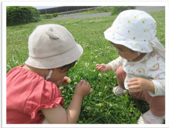
自然と触れ合う中で、 たくさんの驚きと発見があります！