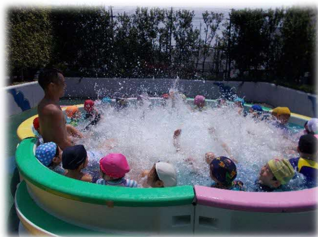
6階 夏のプール遊び