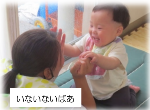
いないいないばあ

安心できる保育者との関わりの中で培われた心の安定が土台となり、成長とともにそれぞれが自信をもって、のびのびと自己表現することができるようになります。