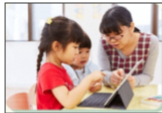
オリジナル児童向け教育コンテンツ“ゆめクリ” (国立宮崎大学教育学部共同研究監修)

英語を学ぶことのできる保育園は増えていますが、当園の英語は英語講師と遊ぶだけではありません。子どもの発達を熟知した保育士と経験豊富な英語講師が作ったオリジナルカリキュラムをTPR教授法とイメージ教育をベースに展開しています。そこにIT会社である強みを活かしたコンテンツを融合した、他にはない英語教育を0歳児クラスから毎日行っています。英語を通じて自由に自己表現ができ、英語を使って国際社会に羽ばたいていく子ども達の育成に力を入れています。