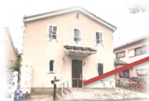
ことのは保育園外観