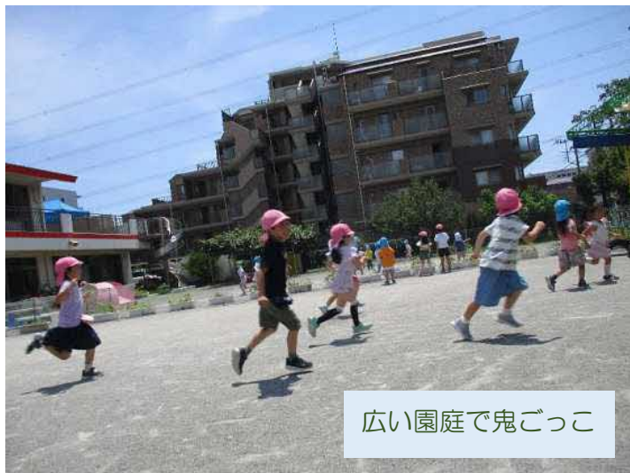
広い園庭で鬼ごっこ