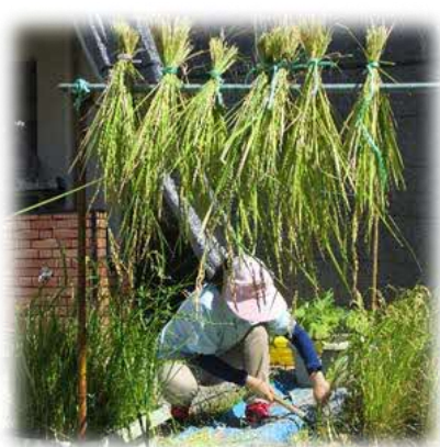
園庭の田んぼと畑で収穫