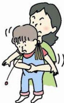
図3 ハイムリッヒ法 (年長児)

大人や年長児では、後ろから両腕を回し、みぞおちの下で片方の手を握りこぶしにして、腹部を上方へ圧迫します(図3)。この方法が行えない場合、横向きに寝かせて、または、座って前かがみにして背部叩打法を試みます。