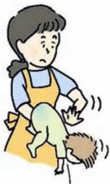
図1 背部叩打法 (乳児)

乳幼児では、口の中に指を入れずに、乳児は片腕にうつぶせに乗せ顔を支えて(図1)、また、少し大きい子は立て膝で太ももがうつぶせにした子のみぞおちを圧迫するようにして(図2)、どちらも頭を低くして、背中の真ん中を平手で何度も連続して叩きます。なお、腹部臓器を傷つけないよう力を加減します。