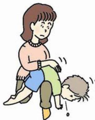
図2 背部叩打法変法 (少し大きい子)