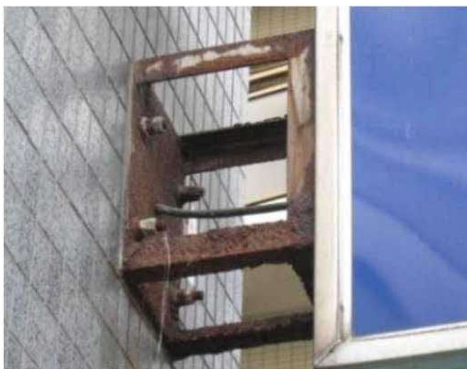
ブラケットの腐食による落下の危険のある看板