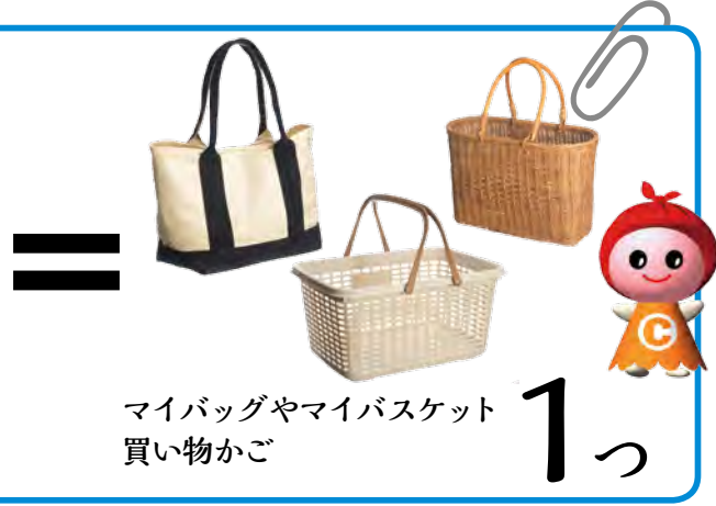
マイバッグやマイバスケット 買い物かご 1つ